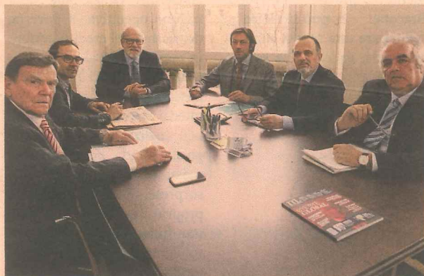
Il Consiglio di Amministrazione di Fiduciaria Marche