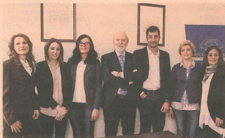
Lo staff di Fiduciaria Marche